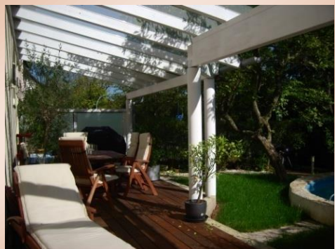
Bildausschnitt von der Terrasse