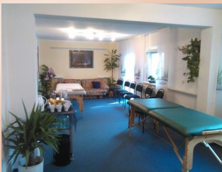
Bild vom Seminarraum 1

Nutzen Sie die Möglichkeit in einer angenehmen Atmosphäre zu lernen und sich fortzubilden. Für Fragen stehen wir Ihnen gerne – auch nachdem Sie Kurse bei uns belegt haben- zur Verfügung.